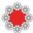
8x19-S + FC