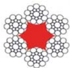
6x19-S + FC