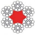
6x19-S + FC